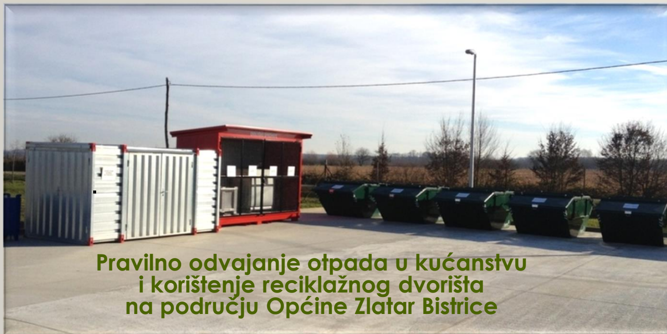
Pravilno odvajanje otpada u kućanstvu i korištenje reciklažnog dvorišta na području Općine Zlatar Bistrice